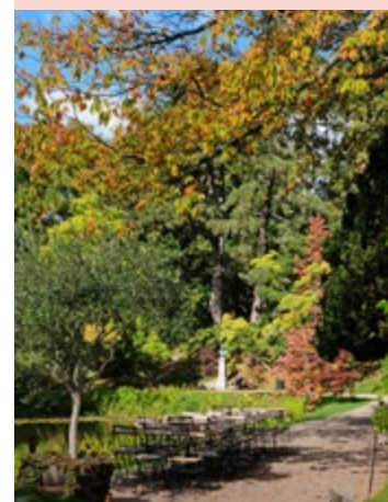
Botaniska trädgården är lätt att njuta av hela året om!