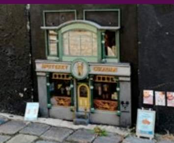
Medan du ser dig om i stan, missa inte Apoteket Cikadan och Anonymouses två andra verk. Gå till Winstrupsgatan, Nygatan och Magle Stora Kyrkogata.