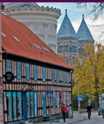
Domkyrkan med sina 55 meter höga torn.