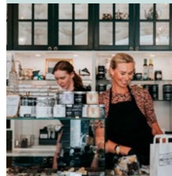
Längs Klostergatan finns smakfullt mat-hantverk som här - Chocolaterie Hovby nr 9 .

Lund värnar om sina lundabor och besökare och tar nya rutiner och restriktioner på allvar för att säkerställa trygga upplevelser. Det är fortfarande ovissa tider, dubbelkolla därför gärna så att uppgifterna stämmer före ditt besök.