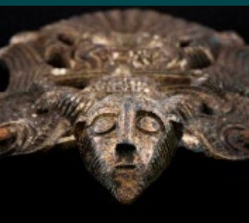
Fynd från Uppåkra Arkeologiska Center. Fynden ställs ut på Historiska museet i Lund.