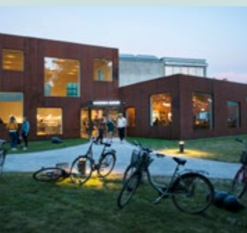
På Skissernas hittar du På Skissernas, ja restaurangen alltså.

I Lund är stadsbussarna gröna. De gula bussarna går utanför Lund och 159an tar dig till naturen.